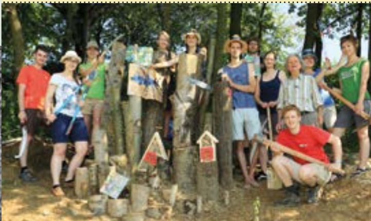
Conservation Camp im Europaschutzgebiet Höll mit errichteter Käferlarvenburg

Vogelstiketten in Garten und Land 2004, 243 Seiten, zahlreiche Abbildungen € 19,90 Ja, ich möchte PATE / PATIN werden Mit meiner PATENSCHAFT unterstütze ich den weiteren Schutz der 500 Biotope in der Steiermark und sichere dadurch den Erhalt dieser besonderen und einzigartigen Lebensräume. Mein jährlicher Beitrag: _____ Euro Dauer meiner Patenschaft: _____ Jahre (Jahresbeitrag mind. € 50,-) Ja, ich möchte MITGLIED werden Mit meiner MITGLIEDSCHAFT erhalte ich Informationen über aktuelle Veranstaltungen und Ermäßigungen bei Ausflügen und Exkursionen. (Jahresbeitrag mind. € 30,-) Unterschrift _____